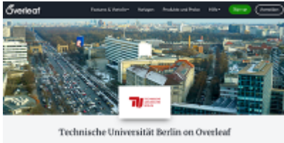
Overleaf-Portal der TU Berlin