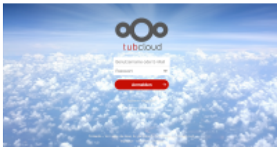
tubCloud mit Collabora-Office-Integration