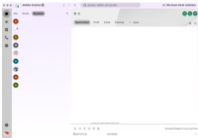
Download der Webex-Teams-Applikation