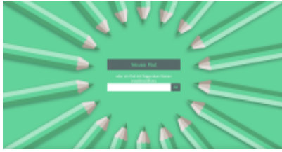
Etherpad von innoCampus