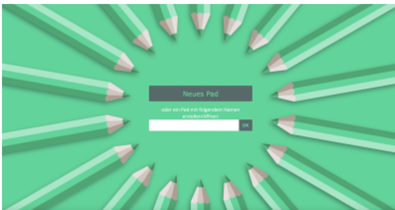
Etherpad von innoCampus