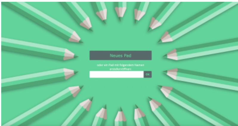
Etherpad von innoCampus