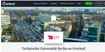
Overleaf-Portal der TU Berlin